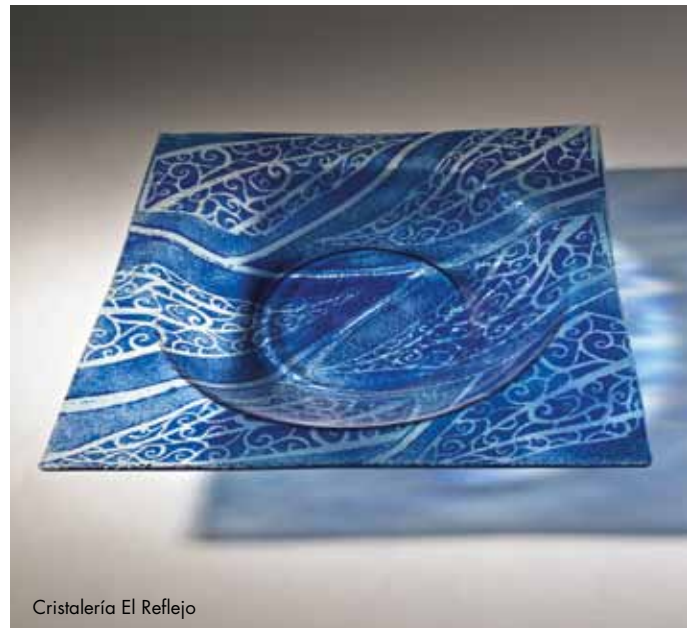
Cristalería El Reflejo