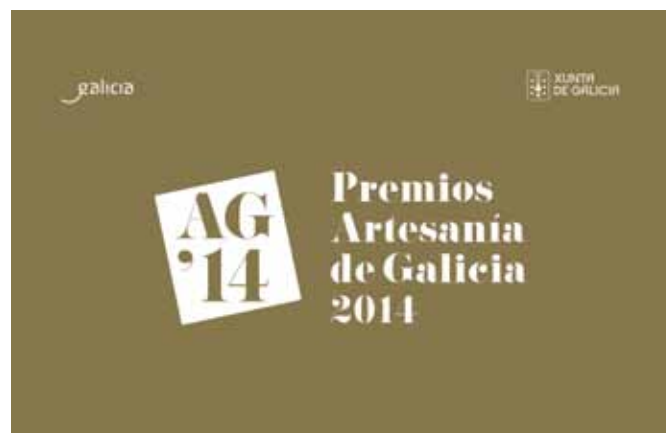
Premios de Artesanía de Galicia 2014