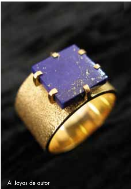
Al Joyas de autor