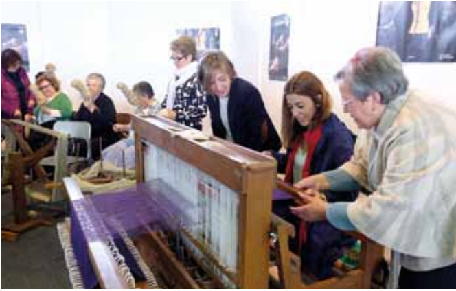
Fía do liño en Baio

ría, a olería, a elaboración de instrumentos musicais, o téxtil, a cestería, a marroquinería, a elaboración de redes ou de zocos, a montaxe de moscas para a pesca, a tornearía de madeira ou a cantería.