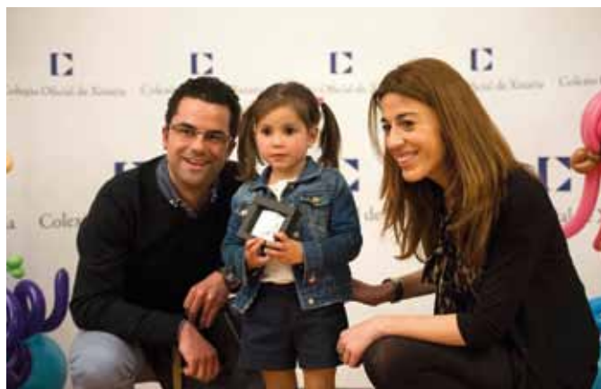
VI Concurso Deseña unha xoia para túa nai

Las Subvencións para a mellora da imaxe, modernización, establecemento de novas fórmulas e medios de comercialización no sector comerciante retalista e artesanal galego para o ano 2015 de la Consellería de Economía e Industria fueron presentadas al sector en diferentes jornadas en Sanxenxo, Ourense, Ferrol y Cangas do Morrazo, en las que participaron profesionales de la artesanía.