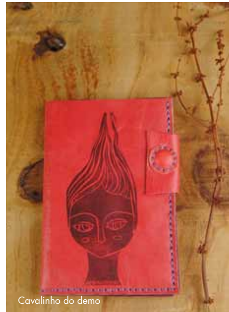
Cavalinho do demo