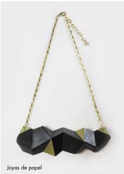
Joyas de papel